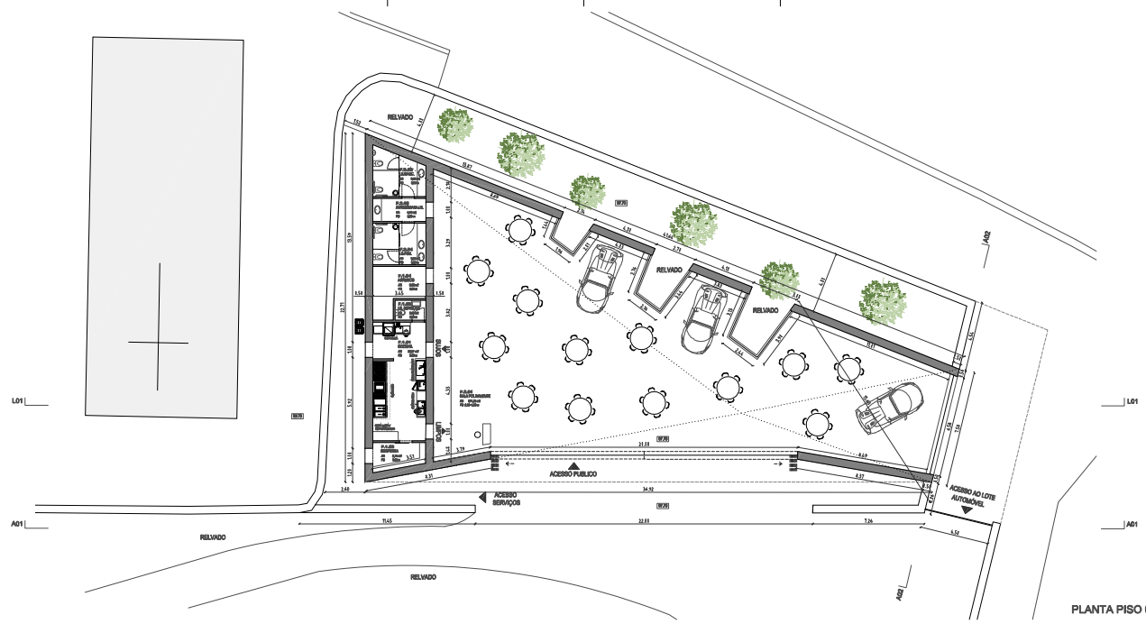
PLANTA PISO 0